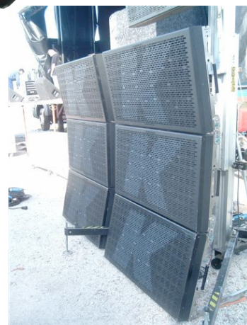
Couplage de 6 KS4.