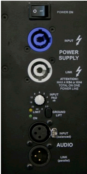
Alimentations et Audio