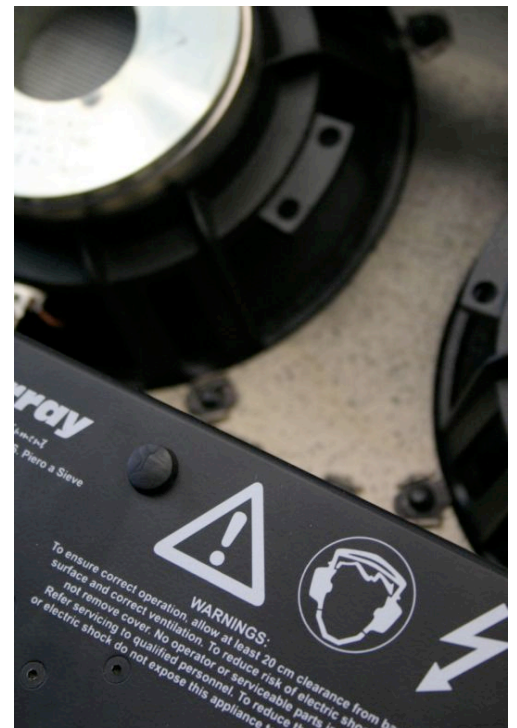
Intérieur de KS4