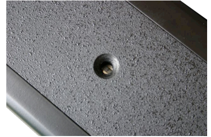
Visuel de couverture verticale