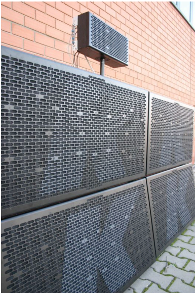
1xKH15 + 4xKS4