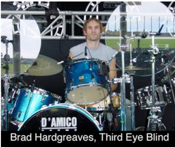
Brad Hardgreaves, Third Eye Blind